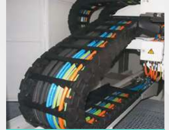
Caterpillar Silencioso de Alta Velocidad